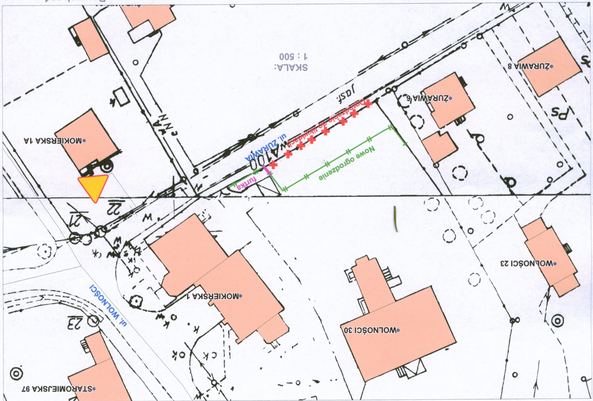
Rysunek nr 1